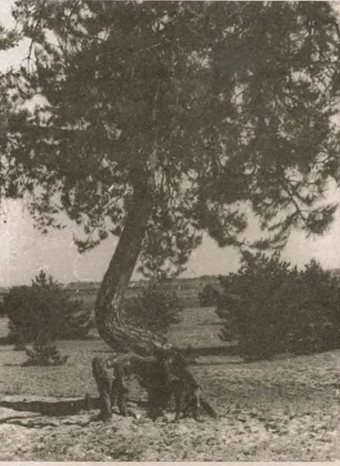
Пасля асушэння балотаў

— Віктар Нікіфаравіч, многія ведаюць пра праблему палескага рэгіёну, але толькі адзінкі ўяўля-